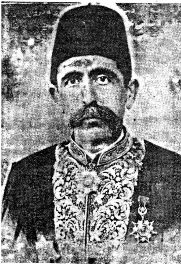
مه‌حمود پاشای جاف به به‌رگی پاشاییه‌ره